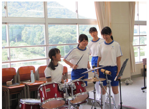
【小学6年生部活動体験の様子】