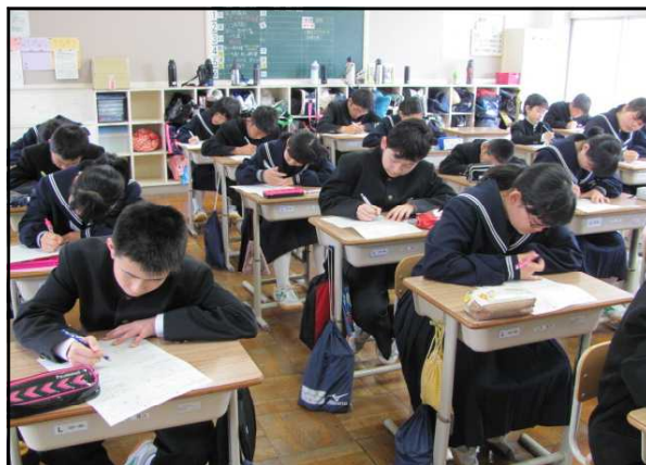
《集中する授業の様子》