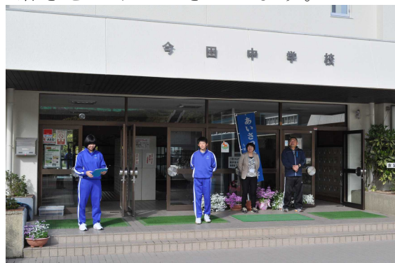
【生徒会あいさつ運動の様子】

2月末からの高校の卒業式、4月最初の高校の入学式に出席をさせていただきました。ある高校でのことですが、渡り廊下を歩いていると、部活動で体力トレを行っていたバレーボール部がわざわざ歩み寄って来て、「おはようございます」とさわやかにあいさつをしてくれました。背筋を伸ばして良い笑顔で、声も揃っています。なるほど、生徒たちから人気を集める高校であると感じました。